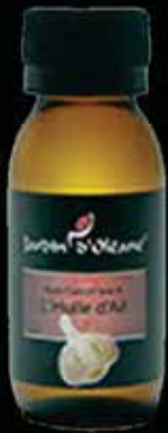
Cosmetic Oil with Sweet Almond Oil