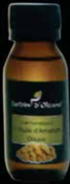
Cosmetic Oil with Sweet Almond Oil