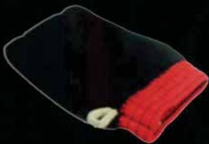
Kessa Glove Eco