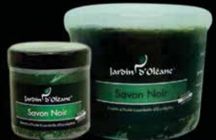
Moroccan Black Soap with Eucalyptus Essential Oil 250g / 1Kg / 5Kg