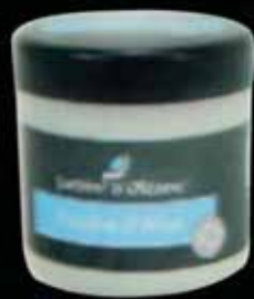
Alum Powder 150g