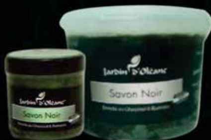
Moroccan Black Soap with Ghassoul & Rosemary 250g / 1Kg / 5Kg