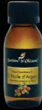
Cosmetic Oil with Roasted Argan Oil