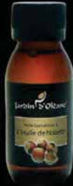
Cosmetic Oil with Hazelnut Oil