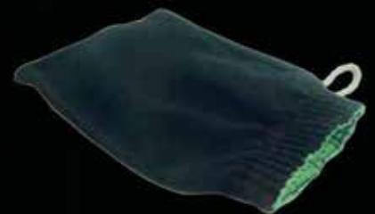
Kessa Glove Premium Large