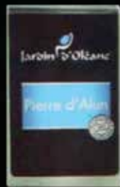
Alum Stone 100g