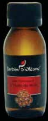
Cosmetic Oil with Castor Oil