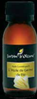
Cosmetic Oil with Wheat Germ Oil