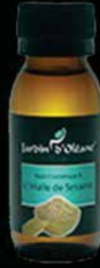
Cosmetic Oil with Sesame Oil