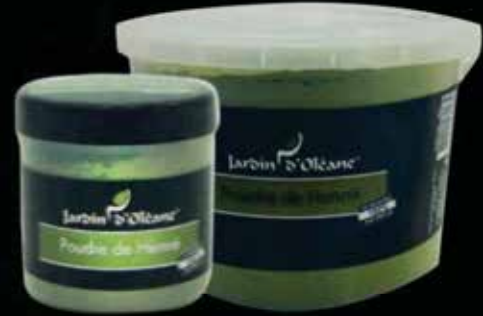
Henna Powder 250g / 1Kg / 5Kg