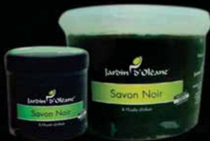
Moroccan Black Soap with Olive Oil 250g / 1Kg / 5Kg