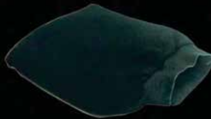
Kessa Glove Premium Medium