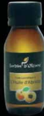
Cosmetic Oil with Apricot Oil