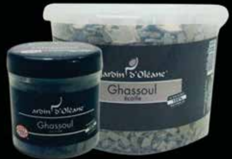
Ghassoul Chips 250g / 1Kg / 5Kg