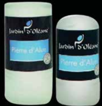
Alum Stone 60g / 120g