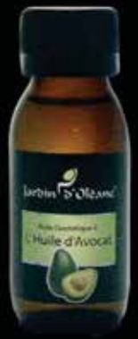
Cosmetic Oil with Avocado Oil