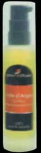
Cold Pressed Argan Oil