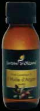
Cosmetic Oil with Cold Pressed Argan Oil