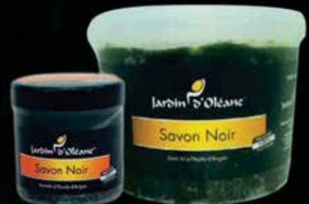
Moroccan Black Soap with Argan Oil 250g / 1Kg / 5Kg