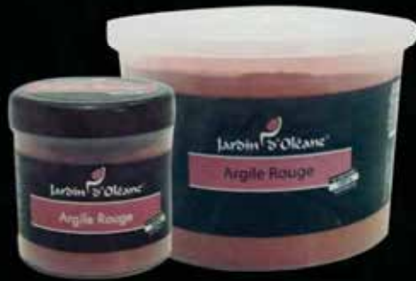
Red Clay 250g / 1Kg / 5Kg