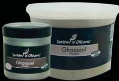
Ghassoul Powder 250g / 1Kg / 5Kg