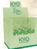
Hair loss and hair thinning preventing line ENERGY SYSTEM