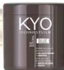
Bio-Activator Oxidizing Emulsion | Bleaching Powder TECHNO SYSTEM