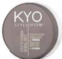
Hairspray | Mousse | Wax STYLE SYSTEM