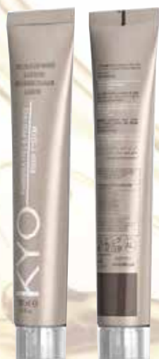
AMMONIA FREE & PPD FREE KOLOR SYSTEM

Take a look at our other products, get ready for the new era!