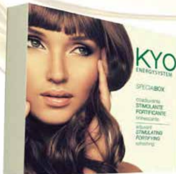
SPECIALBOX Contiene / contains: 1x250ml EnergySystem shampoo 2 boxes of EnergySystem Treatment 1 hair brush