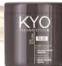
Bio-Activator Oxidizing Emulsion | Bleaching Powder TECHNO SYSTEM