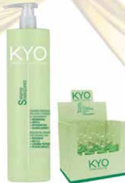
Hair loss and hair thinning preventing line ENERGY SYSTEM