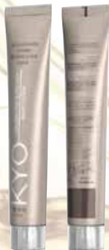
AMMONIA FREE & PPD FREE KOLOR SYSTEM

Take a look at our other products, get ready for the new era!