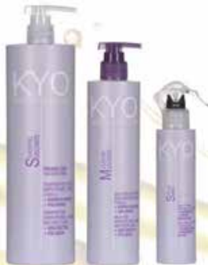
Anti-frizz, softening and nourishing line SMOOTH SYSTEM