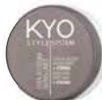
Hairspray | Mousse | Wax STYLE SYSTEM